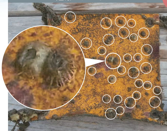
フジツボが大量に付着