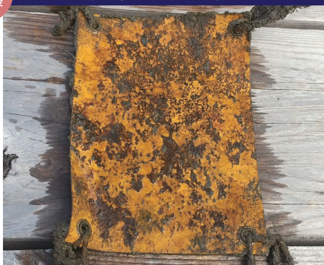
フジツボの付着無し