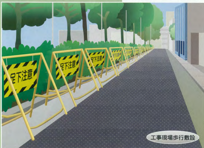
工事現場歩行敷設