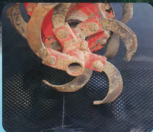
刃物等が当たっても安心

サイズ 1,380mm × 1,880mm (690×940mm 4枚) 重量 15kg 厚み 6mm