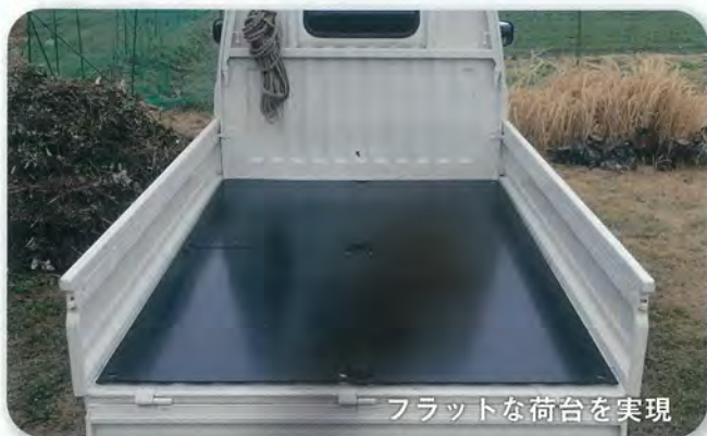
フラットな荷台を実現