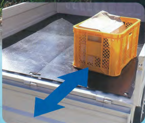
荷台がフラットで積み下ろし“らくらく”

耐候性があり、切れたり破れたりしない強靱性があります。 荷物を滑らせての移動が容易になり積み下ろし作業の軽減に。 荷台を保護し、積載物の傷防止に。ゴムマット等との併用可能。